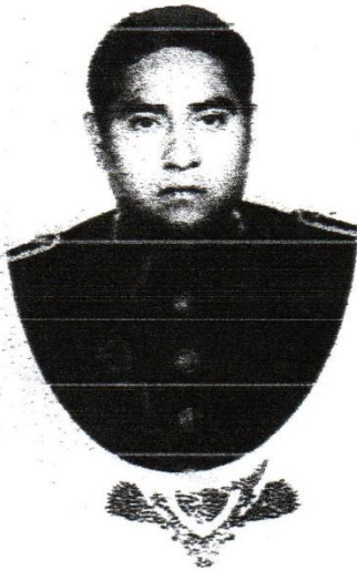
DIRECCIÓN DE LICENCIATURA

Ingeniero en Ciencia y Tecnología de Alimentos